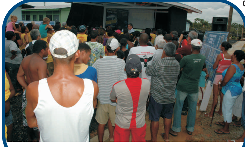
Famílias vão para apartamentos no fim do ano

quadrados. A Prefeitura investiu R$ 4 milhões na construção dos alojamentos que, no futuro, serão utilizados em outros processos de reassentamento. Os apartamentos que estão sendo construídos pelo Minha Casa, Minha Vida têm sala, dois quartos, cozinha e banheiro, e se destinam a famílias que ganham até três salários mínimos.