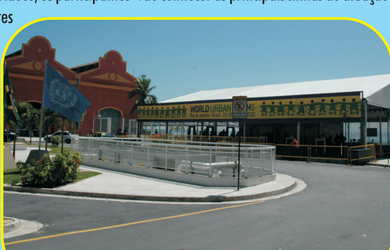
Evento vai reunir 20 mil pessoas na área portuária

As discussões do Fórum são divididas em seis eixos: "Levando adiante o direito à cidade"; "Unindo o urbano dividido"; "Acesso equitativo à moradia; diversidade cultural nas cidades"; "Governança e participação" e "Urbanização inclusiva e sustentável". As edições anteriores aconteceram em Nairóbi (Quênia), em 2002; Barcelona (Espanha), em 2004; Vancouver (Canadá), em 2006; e Nanquim (China), em 2008.