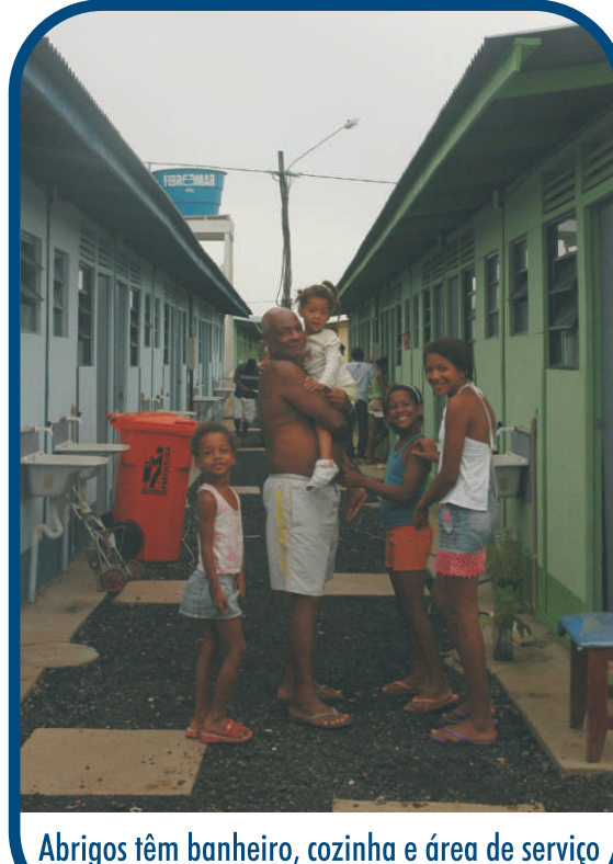
Abrigos têm banheiro, cozinha e área de serviço

Os 352 alojamentos provisórios são distribuídos em 22 pavilhões, cada um com 16 abrigos, em uma área de 8.200 metros quadrados. Com redes de água, esgoto, drenagem e energia elétrica, os abrigos têm área de 21,6 metros