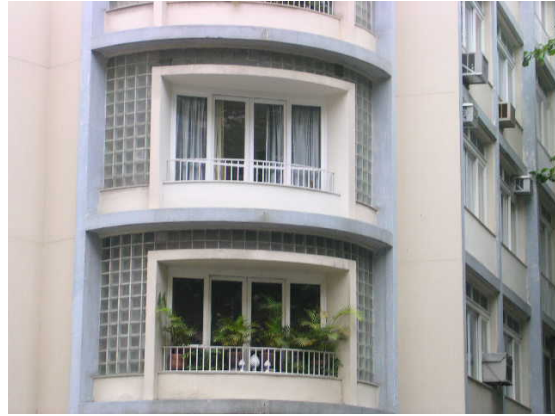
Os pilotis definem vãos livres no pavimento térreo. Detalhe das varandas do corpo cilíndrico, com tijolos de vidro.

A fachada voltada para a avenida Rainha Elizabeth é composta por vãos de janelas de correr, guarnecidas de madeira e vidro, tendo sido algumas delas substituídas por esquadrias de alumínio. A fachada da rua Canning recebe o mesmo tratamento dado à fachada descrita anteriormente e possui um painel em azulejos decorativos no pavimento térreo. Nessa confluência, ainda no andar térreo, se dá o acesso principal ao hall de elevadores da edificação.