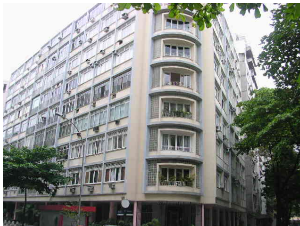
A avenida Rainha Elizabeth liga os bairros de Copacabana a Ipanema