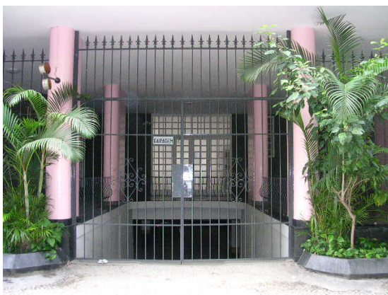
Acesso para veículos na avenida Rainha Elizabeth