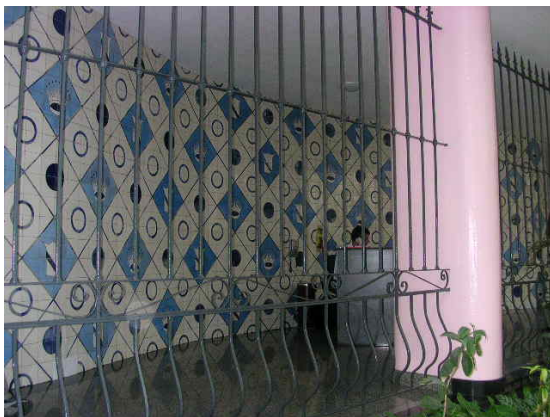
Painel em azulejos com motivos geométricos

A fachada voltada para a avenida Rainha Elizabeth é composta por vãos de janelas de correr, guarnecidas de madeira e vidro, tendo sido algumas delas substituídas por esquadrias de alumínio. A fachada da rua Canning recebe o mesmo tratamento dado à fachada descrita anteriormente e possui um painel em azulejos decorativos no pavimento térreo. Nessa confluência, ainda no andar térreo, se dá o acesso principal ao hall de elevadores da edificação.