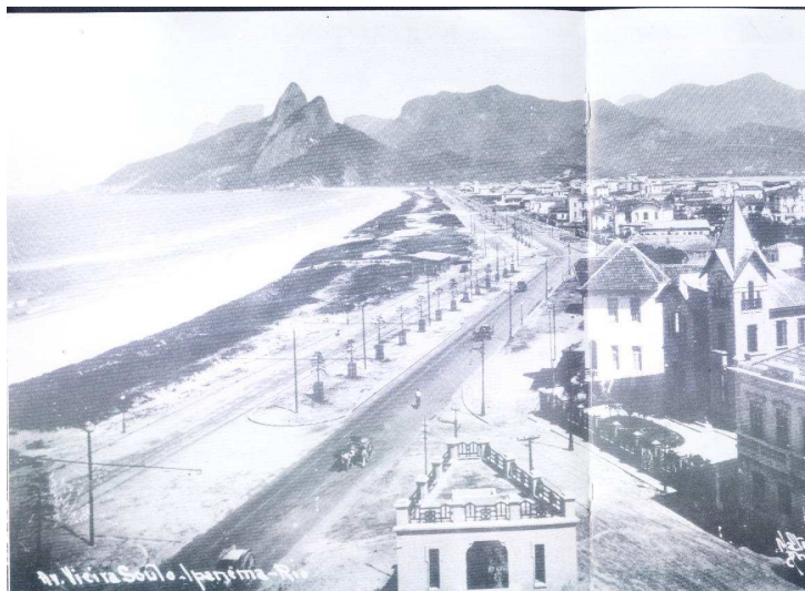
Ipanema e Leblon c.1920

Em 1920, o engenheiro Carlos Sampaio assumiu a Prefeitura do Distrito Federal (1920-1922) com a incumbência de preparar a cidade para as comemorações do Centenário da Independência. Em 1921, durante a sua gestão, é aprovado o projeto de arruamento da área de Ipanema compreendida entre a Avenida Henrique Dumont e a rua Teixeira de Melo e as avenidas Vieira Souto e Eptácio Pessoa. Foi apresentado o traçado em xadrez, de quadras retangulares como os já traçados pelo próprio Barão. Também nessa mesma época, como parte das obras empreendidas pelo prefeito Carlos Sampaio visando o saneamento da Lagoa Rodrigo de Freitas, a antiga praia da Saneada (depois Avenida Ipanema), que ficava de frente para a Lagoa, passou a integrar a recém-aberta avenida Eptácio Pessoa.