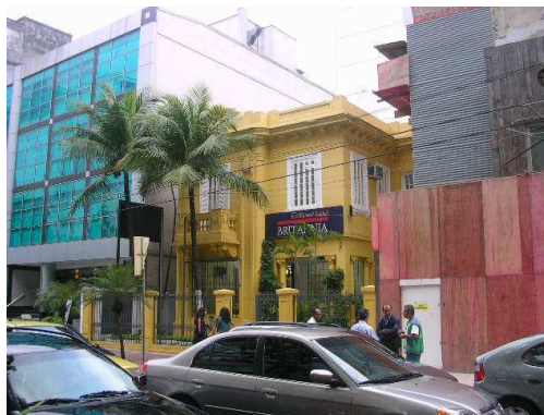
Vista do imóvel de dois pavimentos situado à rua Garcia d'Ávila

A fachada principal exhibe três planos construtivos, sendo que naquele mais próximo do observador, se destaca uma pequena varanda, para a qual está voltada uma porta de quatro folhas, guarnecida de madeira e vidro. Esse balcão é composto por balaústres e pilaretes laterais ornados com medalhões elípticos com elementos florais. É sustentado por dois pares de mísulas nas suas extremidades. Sob esse pavimento, houve modificação no tratamento dado ao vão de janela, que recebeu um pano de vidro e grades verticais como medida de segurança.