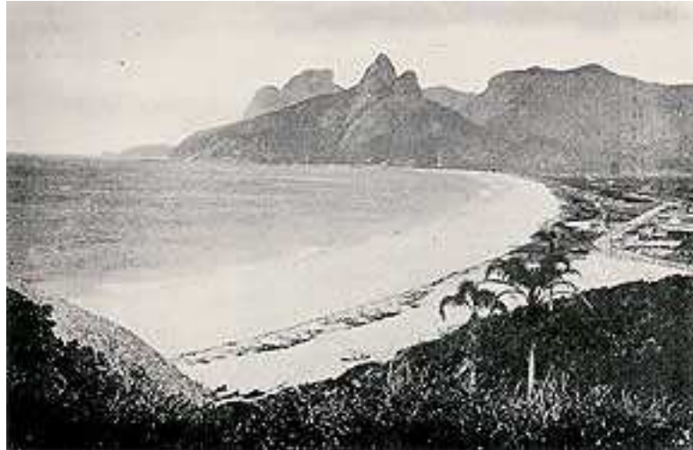
Ipanema e Leblon c.1900