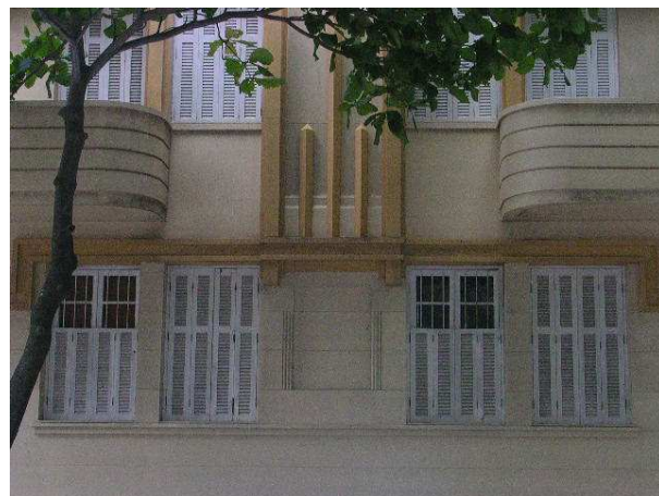
Os vãos de portas e janelas do edifício são guarnecidos de madeira e vidro