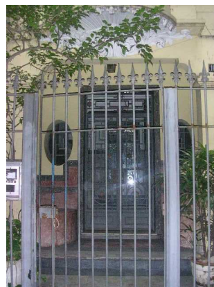
O acesso é feito por um portão em ferro com desenho geométrico