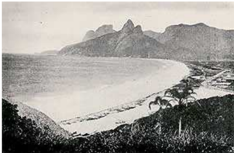
Ipanema e Leblon c.1900