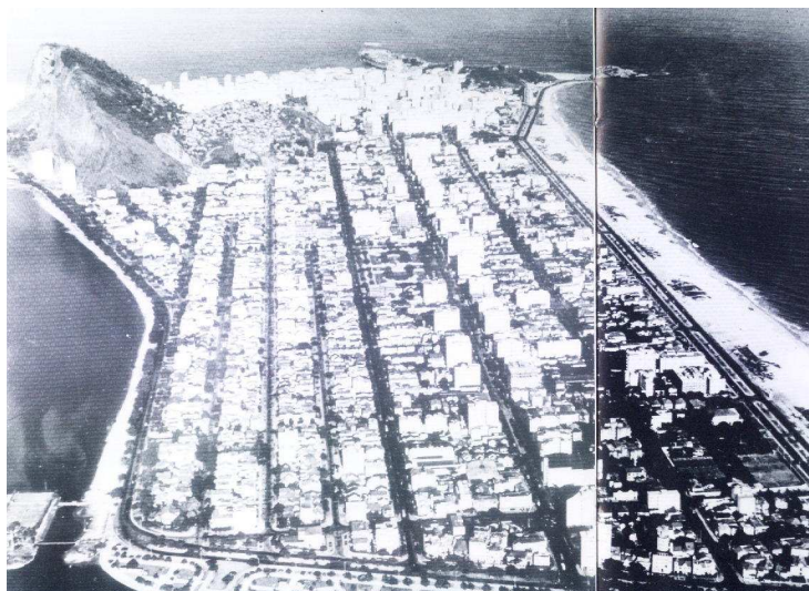
Ipanema e trecho da Lagoa Rodrigo de Freitas c.1960

madrugadas, sem guardas, nem soldados municipais, as praias e as ruas transversais ou centrais dão a aparência de desertos ". Em 1939, Ipanema ainda era considerado o paraíso dos ladrões. Não havia quase policiamento e os assaltos e furtos eram constantes.