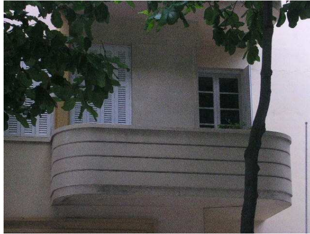
Os guarda-corpos são tratados com sulcos horizontais