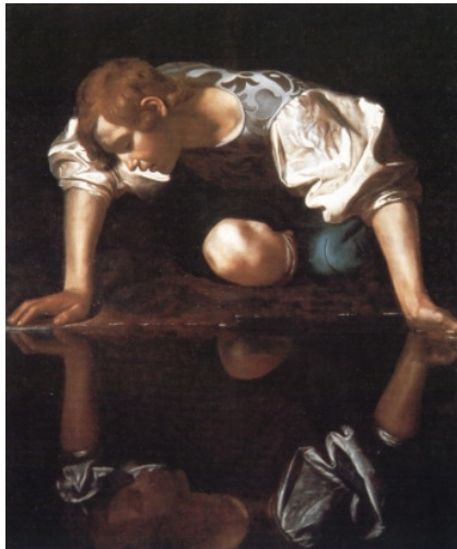
Caravaggio, Narciso http://images.google.com.br/