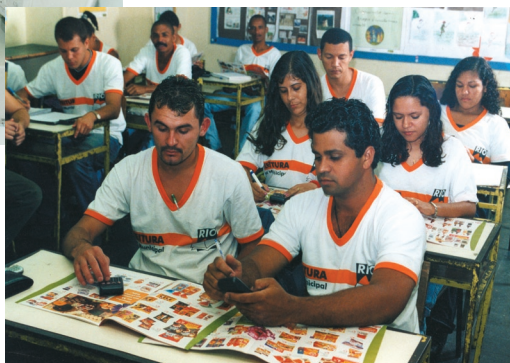
CIEP Patrice Lumumba – E/3ª CRE